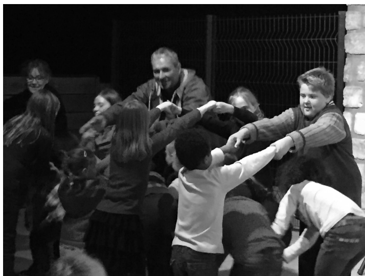
Scène festive extraite de la soirée de la fête des voisins. Bravo à tous les participants !